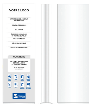
- Totem simple face