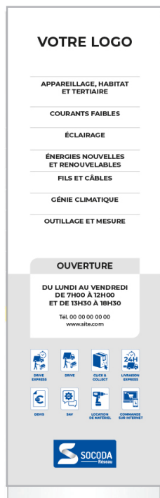
- Totem double face