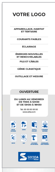
- Totem double face