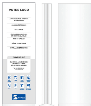
- Totem simple face